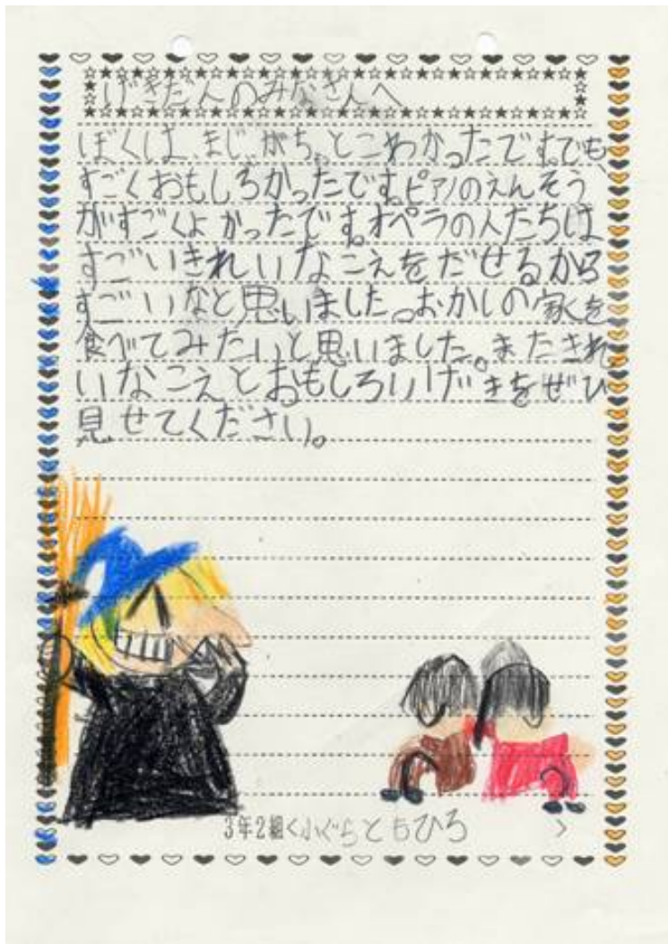
「ヘンゼルとグレーテル」 .1